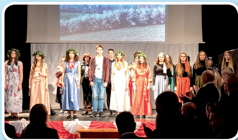
Spektakl „Klimontowskie Echa”