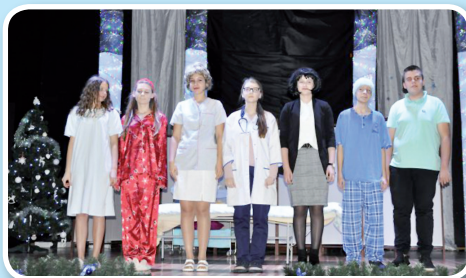
Szkolne koło teatralne

Szczegółowe informacje i dokumenty do pobrania na stronie